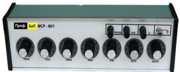
Модификации ПрофКИП МСР-60/1, ПрофКИП МСР-60/2