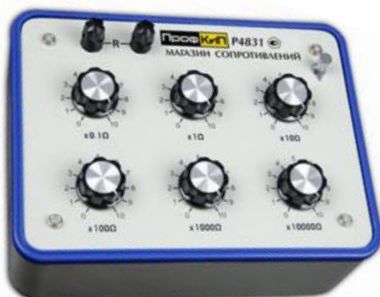
Модификация ПрофКИП Р4831