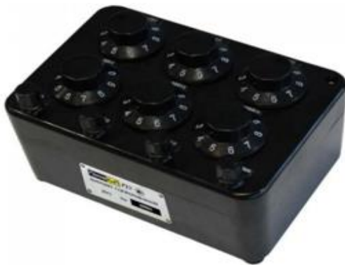
Модификация ПрофКИП Р33

Схема пломбировки от несанкционированного доступа представлена на рисунке 2.