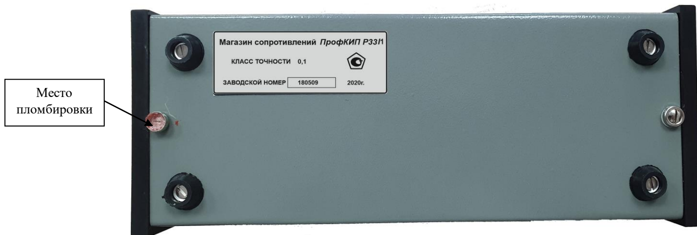
Рисунок 2 – Схема пломбировки от несанкционированного доступа.