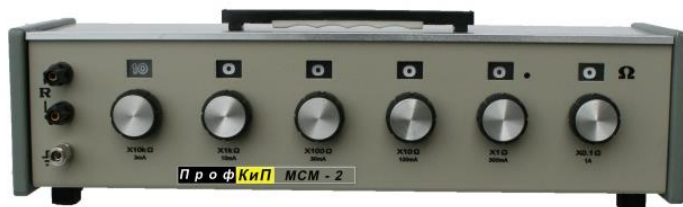
Модификации ПрофКИП МСМ-1, ПрофКИП МСМ-2, ПрофКИП МСМ-3