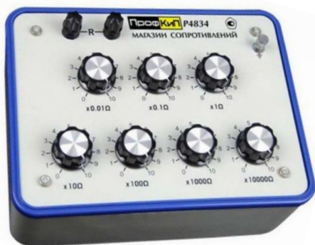
Модификации ПрофКИП Р4834, ПрофКИП Р4834М