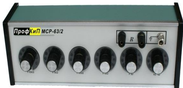
Модификации ПрофКИП МСР-63/1, ПрофКИП МСР-63/2, ПрофКИП МСР-63/3