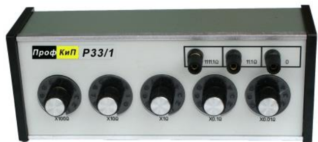
Модификации ПрофКИП Р33/1, ПрофКИП Р33/2