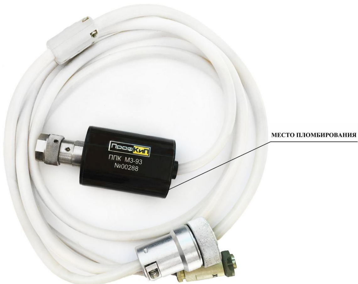
Рисунок 4– Общий вид и схема пломбирования ППК М3-93