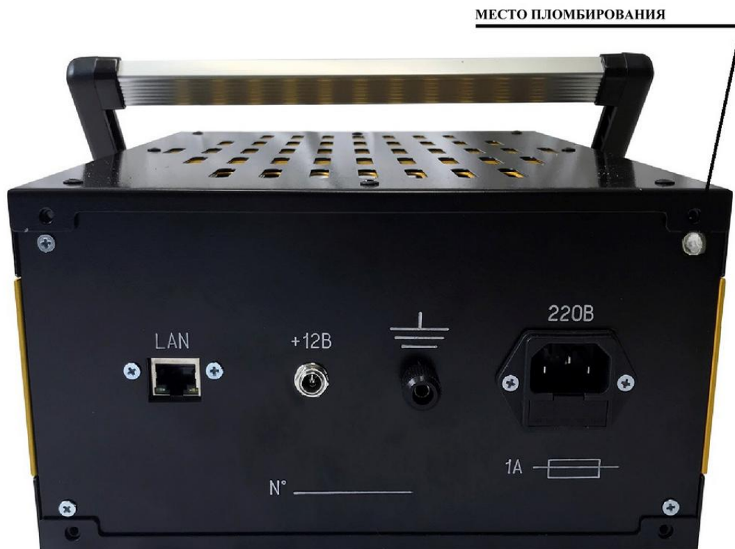
Рисунок 2 – Схема пломбирования блока измерительного от несанкционированного доступа