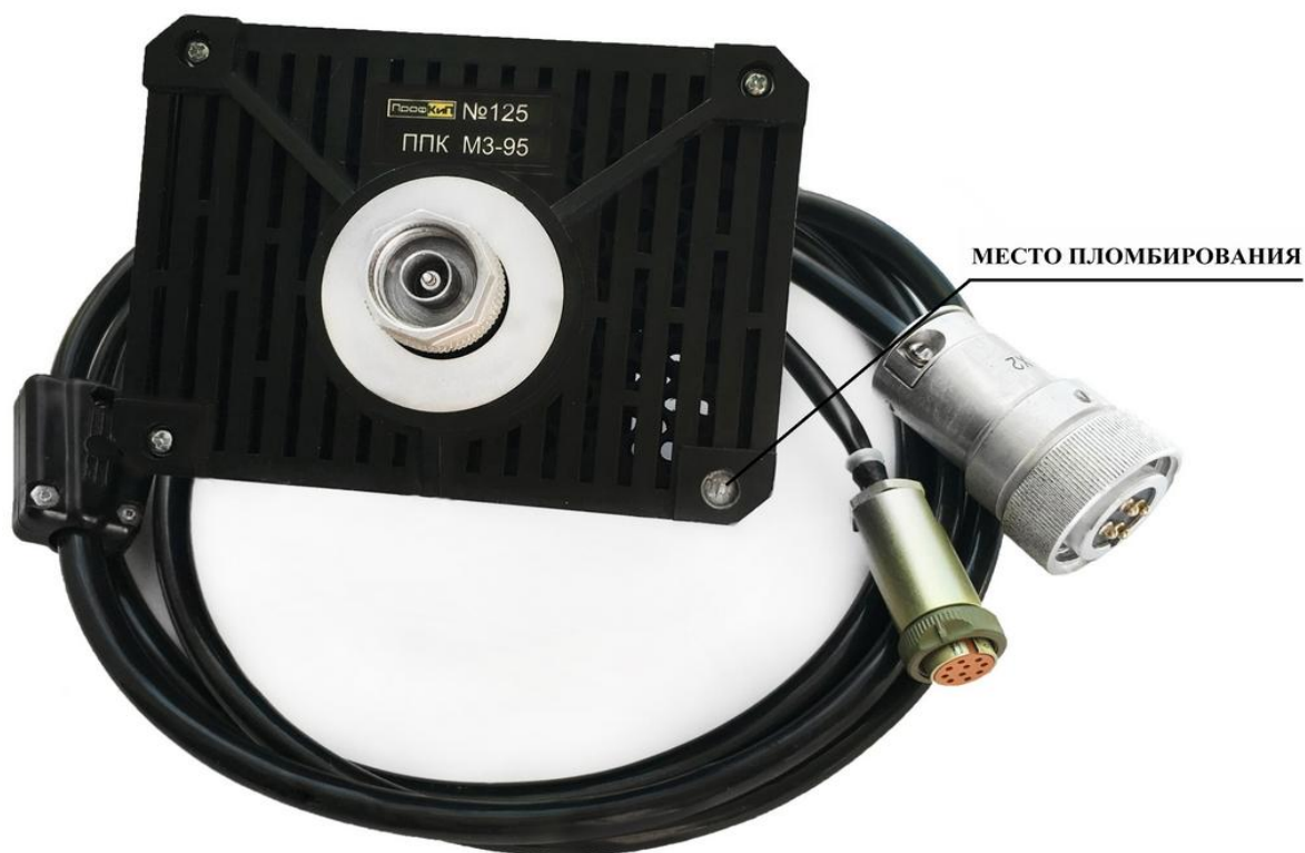
Рисунок 5 – Общий вид и схема пломбирования ППК М3-95