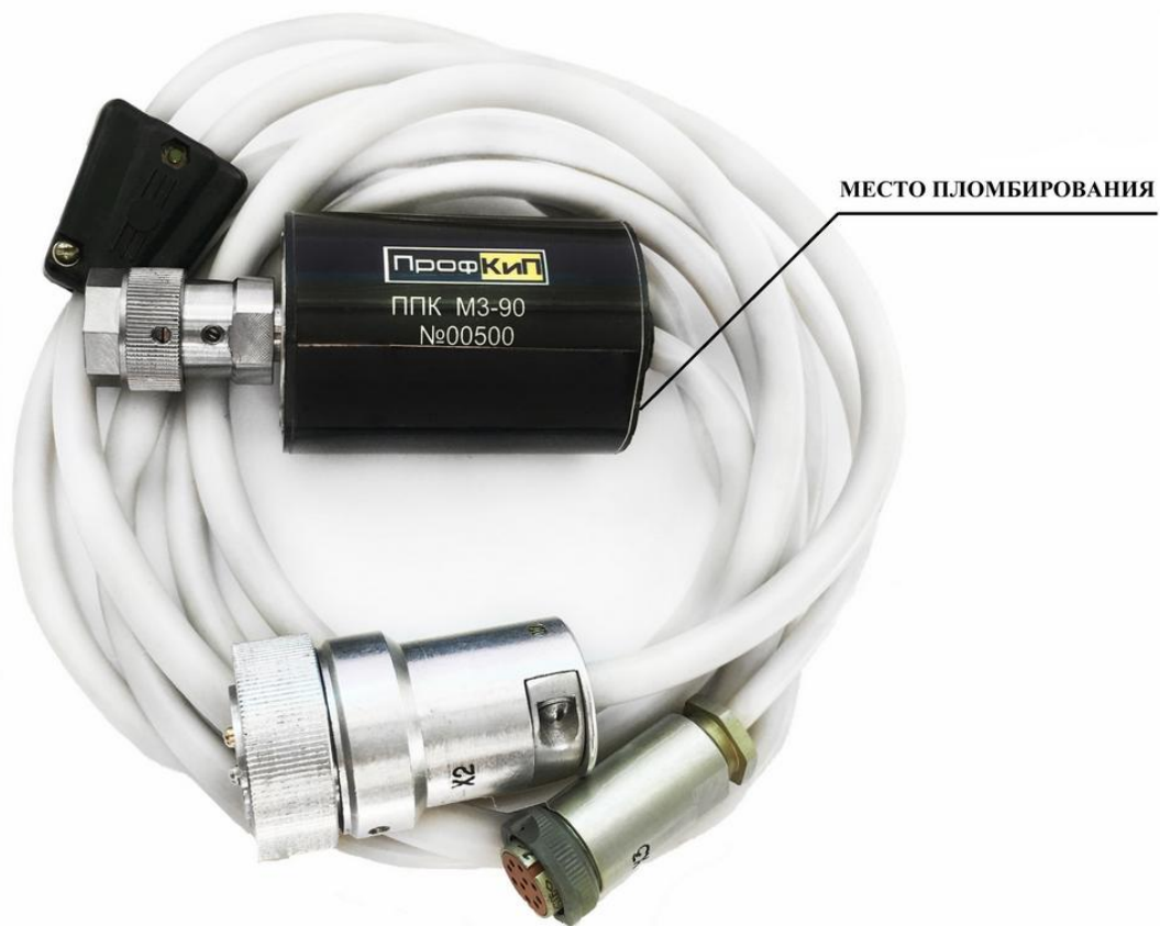
Рисунок 3 – Общий вид и схема пломбирования ППК МЗ-90